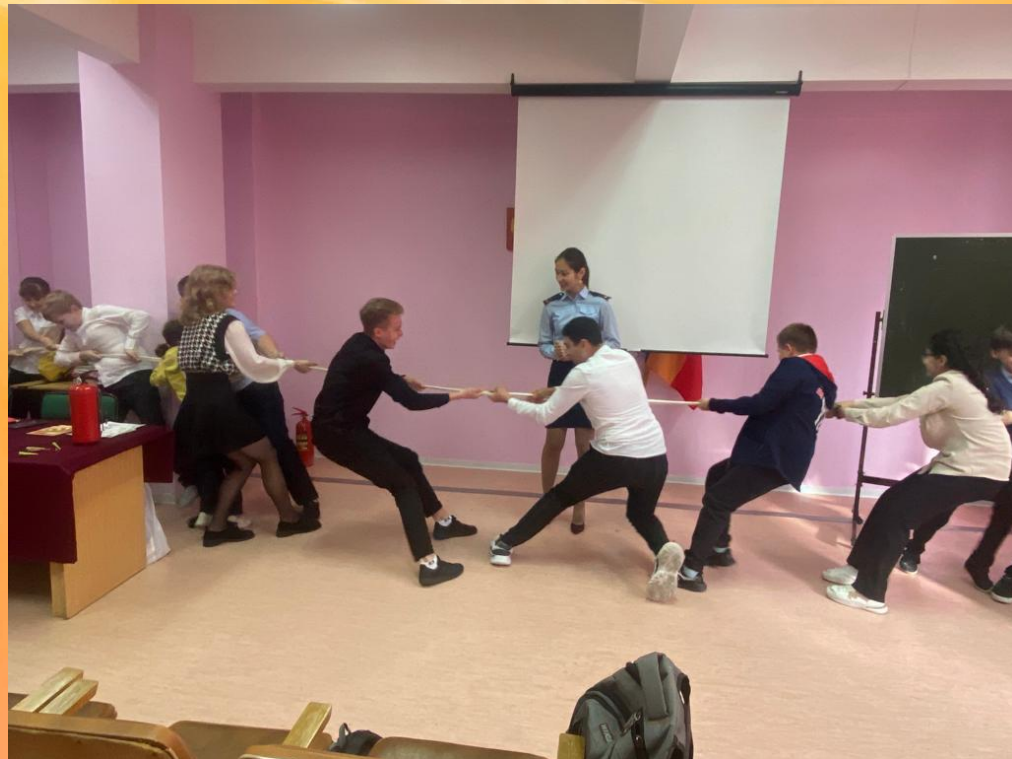
Урок противопожарной безопасности для младших школьников