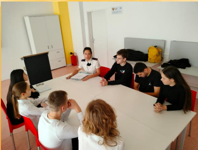
Игровой суд по палу сухой растительности