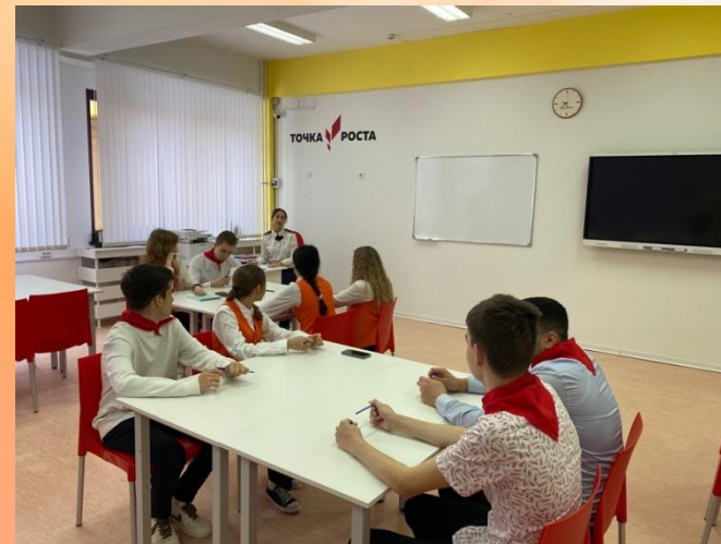
Диктант по пожарной безопасности