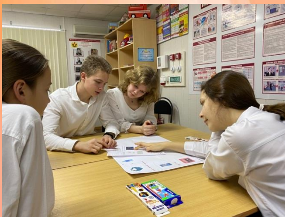
Тестирование по пожарной безопасности