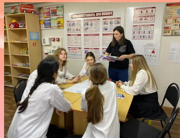
«Пожар в школе и дома»